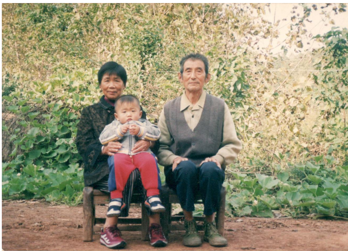
图中是我的父母亲与我儿子年幼时的合照

亲讲打仗的事，父亲说“你还不懂，我那时打仗就是指挥员说上我们就冲，哪有人怕死，我幸运多了能活着回来，我们在一起的战友好多都没回来。”，说着，眼角泛起了泪花，可能是父亲的那些话感染了我，从那时起我就立志要当一名解放军，长大以后我如愿参军，因为父亲的教诲，在部队我坚守规矩、刻苦训练、积极进步，后来也继承了父亲的优秀军魂，在部队立了两次三等功，加入了中国共产党。