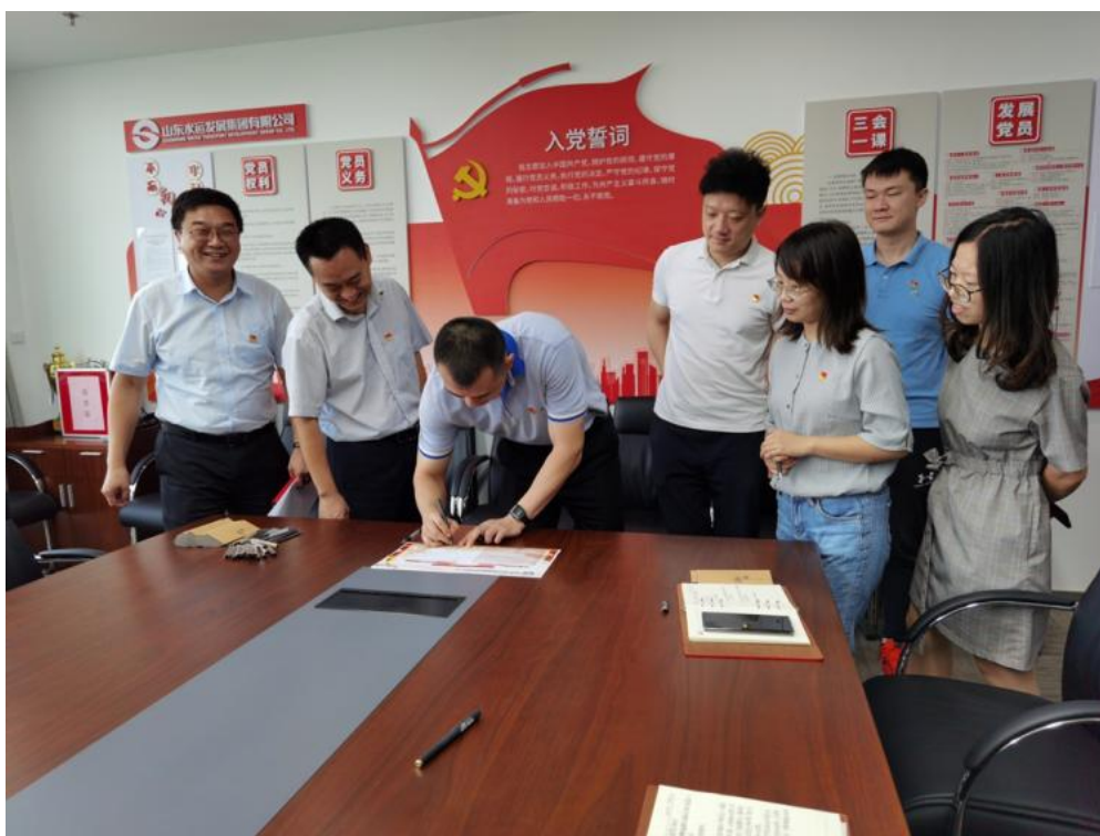
（水运发展本部全体党员签署廉洁过节承诺函）

枣庄分公司党总支充分利用‘一卡一群’推送《关于加强中秋国庆廉洁提醒函》，并对党员领导干部开展了节前廉洁谈话；泰安分公司组织召开中秋、国庆“双节”廉政专题会，对加强节日期间党风廉政建设工作进行了安排部署，对与会的党员干部进行了廉政恳谈，强调廉洁过节。