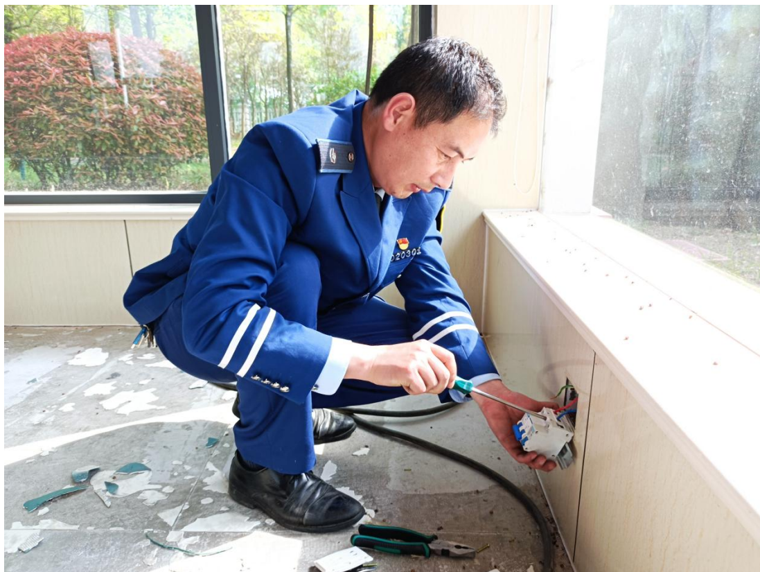
图中是参加“美丽厂区”建设活动的工作照

把父亲当年告诫我的话，原汁原味的说给我的孩子听。我觉得父亲在给我说这些话的时候，应该也是想让我在将来的某一天，让我把同样的话讲给我的孩子听，这便是我的家风。