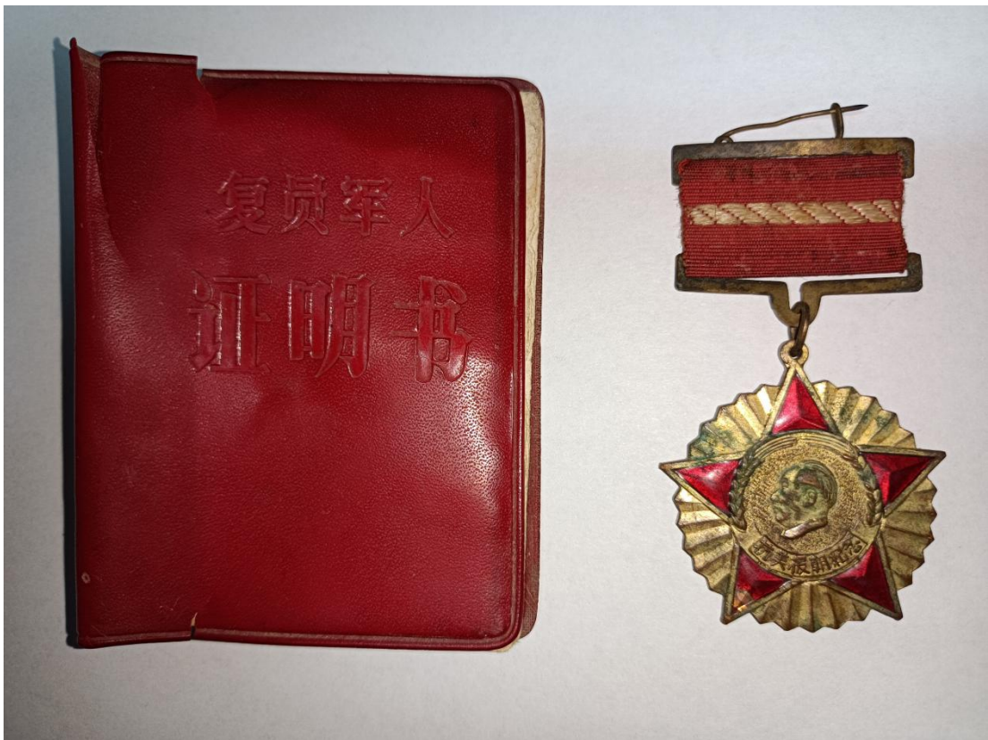
图中是我父亲参加“抗美援朝战争”获得的纪念章以及退伍时的复员证

时间像一个步履匆匆的行人，走到很急也很快。我们父母那一辈人目睹了祖国从站起来到富起来的坎坷过程，而我们这一代人正见证着我们的祖国从富起来到强起来的奋斗历程。像祖国伟大的发展史一样，我们成长的旅途中，都曾经历过风风雨雨，但在我们的身后，总有一股强大的力量支撑着我们一直向前走，那就是“家风”。