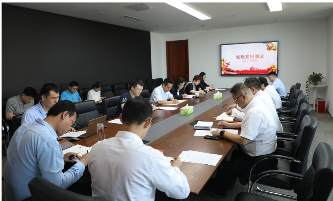
（公司本部组织全体党员开展党规党纪知识测试）

此次专题学习和知识测试重点围绕《中国共产党纪律处分条例》等党纪知识和《保密法》等法律法规，结合现场知识测试，进一步促进党员领导干部将党纪法规真学真懂、入脑入心，达到“以考促学、以学促廉、践廉于行、知行合一”的目的。在集中学习和测试的基础上，还充分运用“学习强国”等学习平台，推进线上学习，切实做到学深悟透。