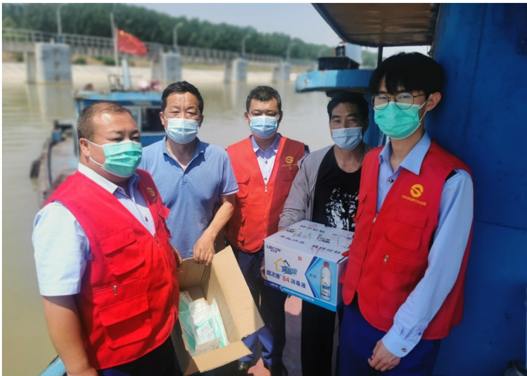
（济宁分公司登船服务船民）

受疫情影响，部分船舶防疫物资匮乏，无法登岸采购。5月20日，济宁分公司3名纪检人员了解到该情况后，主动联系相关船员，利用船舶在长沟船闸远调站待闸期间，登上船头，为船员送上口罩、消毒液等防疫物资和其他急需生活用品，并协助船员做好消杀工作，提醒船员落实船舶消毒、通风等防控措施，注意航行安全，确保安全过闸。济宁分公司纪检人员还积极向船员宣传了公司廉洁文化，主动邀请船员对公司各项工作进行监督。（济宁分公司 商坤朋）