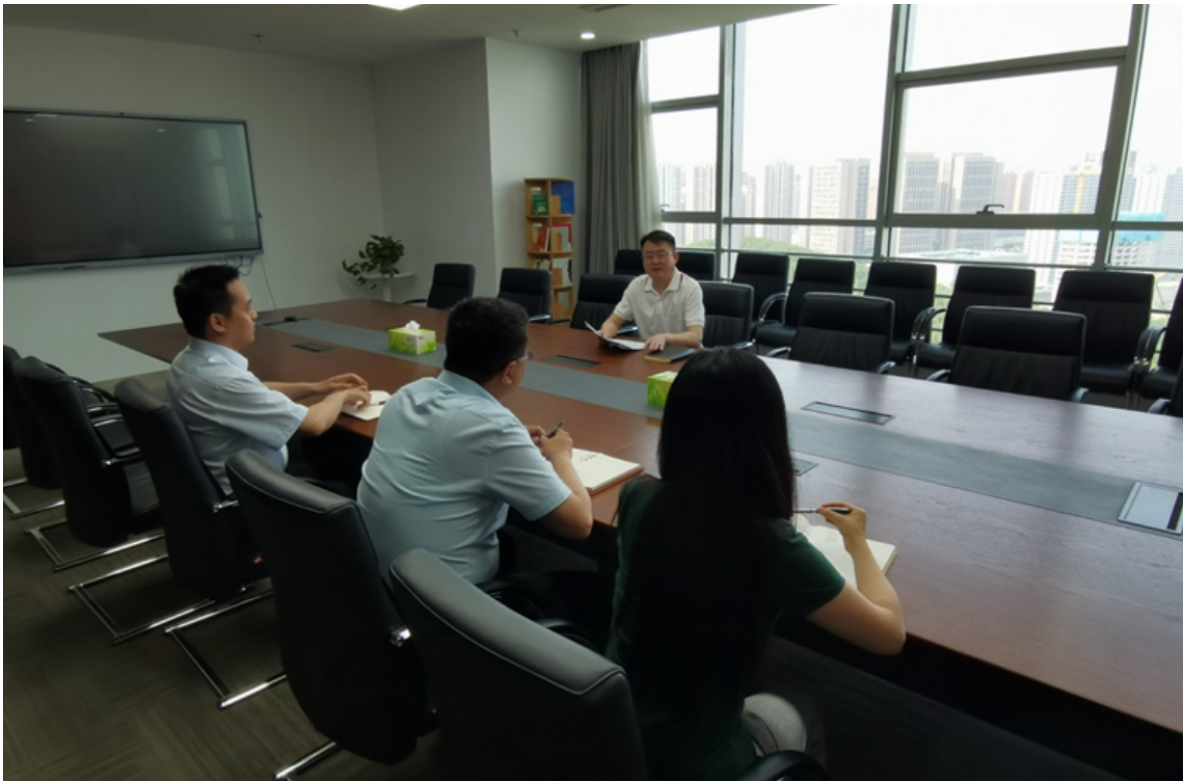
（公司纪委“规范化法治化正规化建设年”专题会议）

会议，传达学习了集团公司《实施意见》，结合公司实际，研究制定了《实施意见》贯彻落实方案。