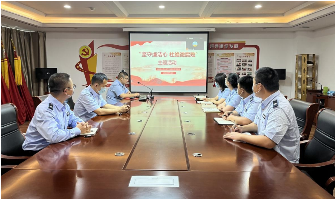
（洮水河公司“坚守廉洁心，杜绝微腐败”主题教育活动现场）

本次主题教育活动分为三个部分：《坚守廉洁心，杜绝微腐败》主题廉洁党课有效引导全体党员深刻认识了“微腐败”的危害性和坚守职责杜绝“微腐败”的必要性；观看警示教育片《零容忍》之“打虎拍蝇”提醒全体党员时刻警醒，坚守道德与理性底线；最后开展的的党规党纪测试，让党规党纪学习入脑入心，增强纪律规矩意识和拒腐防变能力。（洮水河公司 崔伟娜）